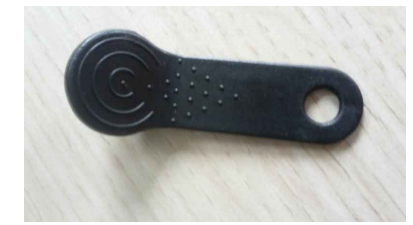
toegangsdruppel t.b.v. bediening buiten de lift