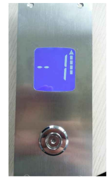
bedieningspaneel buiten de lift