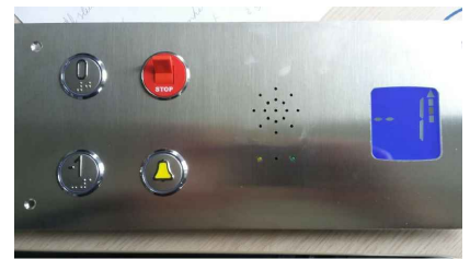
bedieningspaneel in de lift